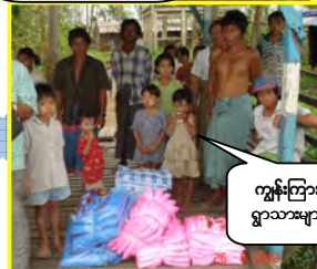
ကျွန်ကြား ရွာသားများ

လိုသလား၊ ကျွန်တော်တို့က စင်ကာပူကလာတဲ့ မြန်မာတိုင်းရင်းသား ခရစ်ယာန် တွေဖြစ်ကြောင်း ဒီရွာမှာ ၂နာရီလောက်နေပြီး ပြန်တော့မှာ ဖြစ်ကြောင်း ပြောပြ တော့မှ အကူအညီလိုကြောင်း ပြောပါတယ်။ မကြာခင် ရွာသူရွာသားတွေ တဖွဲ့ဖွဲ့ ရောက်လာပြီး ရောဂါပေါင်းစုံလာ ပြကြပါတယ်။ လူနာအယောက် တစ်ရာနီးပါးရှိပါ တယ်။ လူနာတွေကလဲ ဆရာဝန် ပြုချင်သလို ကျွန်တော်တို့ အဖွဲ့ကလဲ အချိန်လု ပြီး ဆေးကုနေရတာဖြစ်တဲ့အတွက် တော်တော်တော့ ကတိုက်ကချိုက် ဖြစ်ပါတယ်။