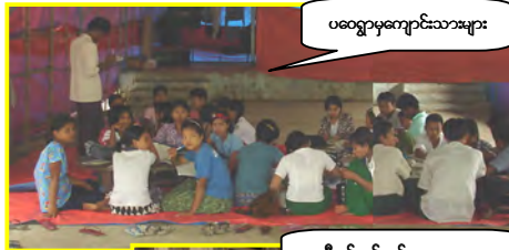
ပဝေရွာကျောင်းသားများ