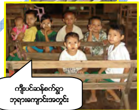
ကျီးပင်ဆန်စက်ရွာ ဘုရားကျောင်းအတွင်း