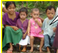
ပဝေရွာမှ ကလေးများ