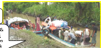
ပဝေရွာလှေဆိပ်၊ စာရေးသူတို့ အသုံးပြုခဲ့သော စက်လှေနှစ်စီး