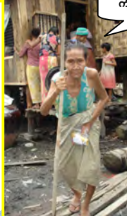
ကျီးပင်ဆန်စက်ရွာမှလူနာများ