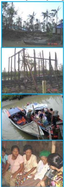
ကျွန်ုပ်တို့အဖွဲ့က ရွာထဲမှာ ဆေးကုပေးနေတဲ့ အခန်းကဏ္ဍများ

ကယ်ဆယ်ရေး အဖွဲ့တွေ မရောက်လာမချင်း သူတို့ဟာ အဲဒီ ဆန်အပုပ်ကို ပြုတ်သောက် လာခဲ့ရပါတယ်။ ကျွန်းတိုင်းကြီးတွေနဲ့ အခိုင်အမာ ဆောက်ထားတဲ့