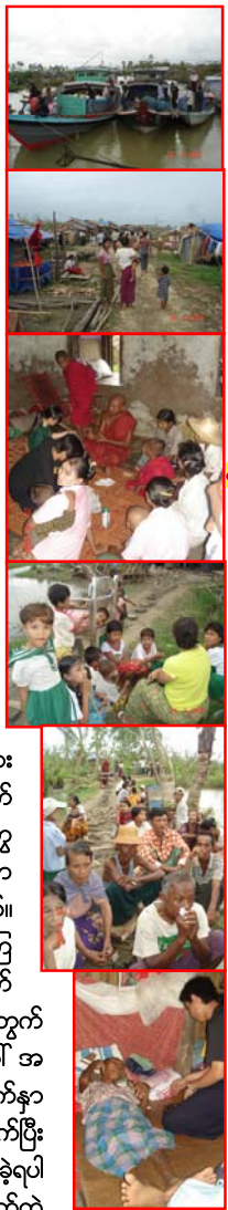
အောင်ချမ်းသာရွာ လှေဆိပ်၊ ဆေးကုပေးနေသည့် ဆေးကုပေးခန်း၊ ဆေးကုပေးနေသည့် ဆေးကုပေးခန်း၊ ဆေးကုပေးနေသည့် ဆေးကုပေးခန်း