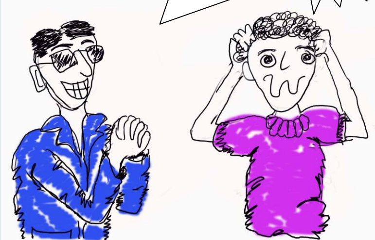
ကာတွန်း - ခိုးကူးသြဂါဒ [သရုပ်ဖော်ပုံ - မင်းအောင်သက်လွင်။ အတွေး - တောသားလေး]