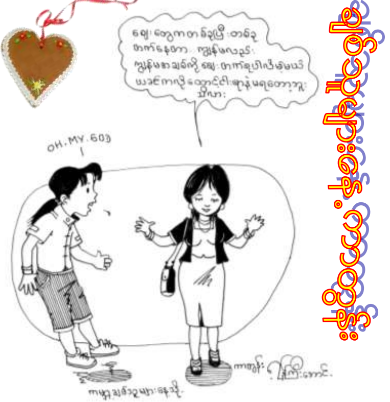
ကျေးဇူးတင် တစ်ခုပြီး တစ်ခု တက်နေတာ။ ကျမလဲ ကျမ အချစ်ကို ဈေးတက် ရပါလိမ့်မယ်။ အရင်ကလို ထောင့်ငါးရာနဲ့ မရတော့ဘူး သိလား။ ( အိုး မိုင် ဂျေ )