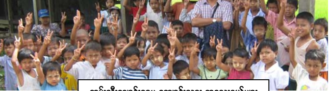
ကွမ်းသီးချောင်းရွာမှ ကျောင်းသား ကလေးငယ်များ