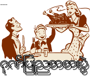
ဂုဏ်ပြုညစာစားပွဲ

လက်မှတ်လေးကို ကျမ်းစာအုပ်ကြားထဲ ညှပ်ထားရင်း ညစာ စားပွဲနေ့က ကျွန်တော် မလေးရှားနိုင်ငံကို ဘုရားသွား ရှိရိုးသွားဖို့ ကိစ္စပေါ် လာတဲ့အတွက် ဂုဏ်ပြုပွဲ မသွားဖြစ်လို့ ကျွန်တော် ရထားတဲ့ ညစာ စားပွဲ လက်မှတ်ကို ဂုဏ်ပြုပွဲမှာ သဘာပတိလုပ်ဖို့ လှလှပပပြင်ဆင်ထားတဲ့ ကျွန်တော် တို့ အိမ်မှာနေတဲ့ အစ်မရဲ့ လက်ထဲ ပြန်အပ် လိုက်ပါတယ်။ သူငယ်ချင်း ဖြစ်သူက ကျွန်တော့်ကိုယ်စား သွားချင်တာမို့ လက်မှတ်ကို သူ့လက်ထဲ ပြန်ထည့် လိုက်ပါတယ်။ သွားခါနီးကျမှ သူငယ်ချင်းက အိပ်ပျော်သွားတာမို့ သဘာပတိ အစ်မက အဲဒီလက်မှတ်ကို ပြန်ယူသွားပါတယ်။ သူငယ်ချင်း အိပ်ယာက နီးလာတော့ ညစာ စားပွဲ သွားမလို့ လက်မှတ်ပျောက်နေတဲ့အတွက် ညစာစားပွဲ မသွားဖြစ်တော့ဘဲ အင်္ကျီပြန်လဲ လိုက်ရပါတယ်။ အဲဒီ လက်မှတ်ကို အကြောင်းပြုပြီး သဘာပတိ အစ်မ ဖြစ်သူက အမှတ်တမဲ့လိုက်ဖြစ်တဲ့ သူ့ မိတ်ဆွေ ကောင်လေး တစ်ယောက်ကို ညစာစားပွဲ လက်မှတ် တစ်စောင် အပိုရှိတယ် လာခဲ့ပါလို့ အရေးပေါ် လှမ်းဖိတ်လိုက်ပါတယ်။ အဲဒီ အမှတ်တမဲ့ ကောင်လေး ကလဲ ညစာစားပွဲ ကျင်းပမဲ့ နေရာကို စက်ဘီး တတန်။ ရထား တတန် ကားတတန် စီးပြီး ရောက်လာခဲ့ပါတယ်။ ညစာစားပွဲ ကျင်းပနေပါပြီ။ မကြာခင်မှာ ဖိတ်စာ လက်မှတ်တွေထဲက နံပါတ်ကို ကံစမ်းမဲ နှိုက်ပါတယ်။ ပထမဆု ပေါက်သွားတဲ့ သူကတော့ ကျွန်တော့် လက်မှတ် ကိုင်ထားတဲ့ အမှတ်တမဲ့ ကောင်လေးဘဲ ဖြစ်ပါတယ်။ တကယ်တော့ ဒီလက်မှတ်ရဲ့ နောက်ကျောမှာ ကျွန်တော့်နာမည် ရေးထိုးထားပါတယ်။ ဆုကို ကျွန်တော် မရ