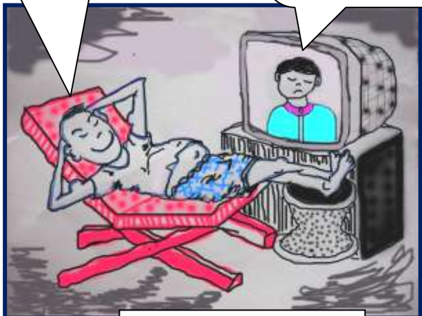
Cartoon ; Min Aung Thet Lwin

ဘုရား သခင်၏ သား တော်ကို ယုံကြည်သောသူ အပေါင်း တို့သည် ပျက်စီး ခြင်း သို့ မရောက် --- မိမိ ၌ တစ်ပါး တည်းသော သားတော်ကို စွန့် တော် မှု သည့် တိုင်အောင် လောကီ သား တို့ကို ချစ်တော်မူ၏ ယောဥဒင်