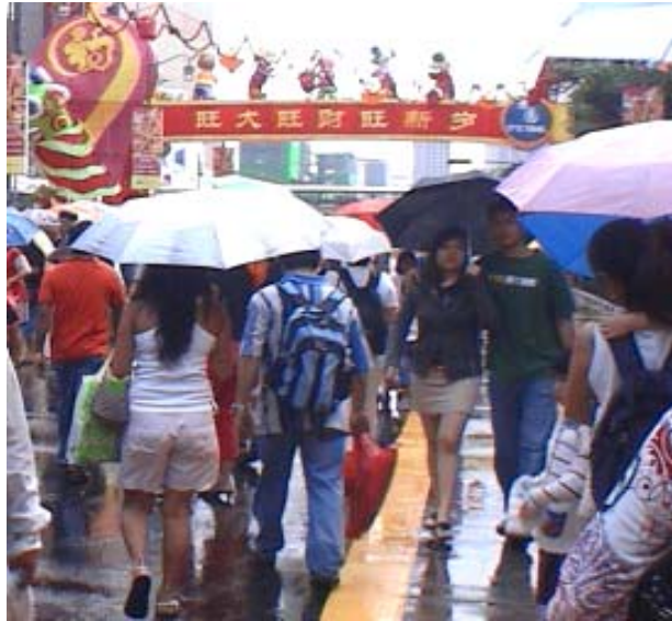
( ဝေတာ ၁၃:၅ - ဓမ္မတ္တာသည့် စိတ်ရှည်တတ်၏၊ ဓမ္မာရူးမြဲတတ်၏။ )

နေ့စဉ်ခွန်အား ဖတ်ပြီး ဒီကျမ်းပုဒ်လေး တွေလိုက်ရတော့ ရင်ထဲမှာ အားချမ်းသွားလိုက်တာ။ တဆက်တည်း မောင့် မျက်နှာလေး ကိုလဲ မြင်ယောင်မိ လိုက်တယ်။ မောင်ကလေး ကျွန်မကို သိပ်စိတ်တိုတတ်တာဘဲတဲ့။ အားအားရှိ ထစ်ကနဲဆို ဒေါနတောင်ပေါ် တက်တော့တာဘဲတဲ့။ ကျွန်မ ကလဲ ကျွန်မ ပါဘဲလေ။ ဒေါသ ထွက်ပြီ၊ စိတ်တိုပြီ ဆိုရင်တော့ အနားမှာ လူရှိရင် ရှိ၊ မရှိရင်တော့ ခွေးတွေ ကြောင်တွေတောင် မလွတ်ဘူးမှတ်။ တွေတာနဲ့ကို ကောက်ပေါက် ပစ်တာ။ မွေးရာပါတဲ ထင်ပါရဲ့။