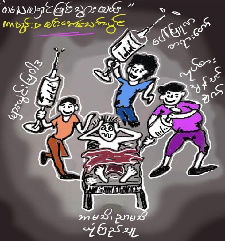
((အခြေပြုကျမ်း။ ။ နောင် ကာလ၌ လူတို့သည် စင်ကြယ်သော ဩဝါဒကို နား မခံနိုင်ဘဲ။ - - များပြားသော ဆရာတို့ နောက်သို့ လိုက်ကြလိမ့်မည်။ သမ္မာတရားကို နားမထောင်ဘဲ။ ဒဏ္ဍာရီ စကားကို နားထောင်၍ လွဲသွား ကြလိမ့်မည်။ ၂တိ ၄:၃ ))